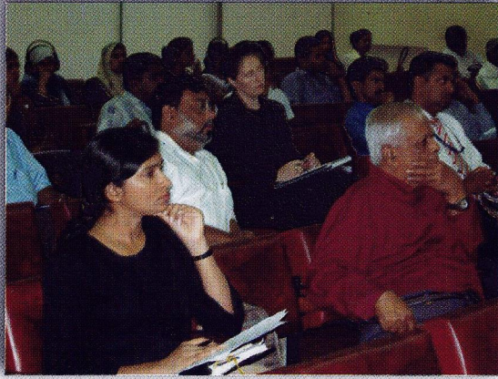
රැස්වීම් සභාවෙන් කොටසක්...